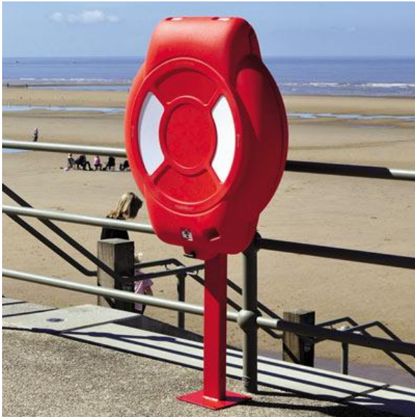
Att.2 Glābšanas stenda piemērs.

Piestātne jāaprīko ar glābšanas stendu, kas sastāv no glābšanas riņķa 30", virves 40m, virves turētāja un statīva ar aiztaisāmu vāku. Glābšanas stenda vāka roktura augstums no zemes 90cm. Glābšanas stendam jābūt piemērotam apkārtējās vides iedarbībai.