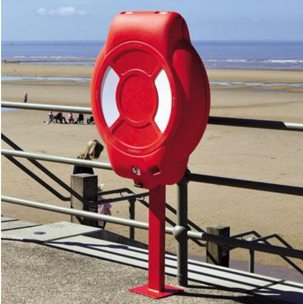
Att.2 Glābšanas stenda piemērs.

Piestātne jāaprīko ar glābšanas stendu, kas sastāv no glābšanas riņķa 30'' , virves 40\text{m} , virves turētāja un statīva ar aiztaisāmu vāku. Glābšanas stenda vāka roktura augstums no zemes 90\text{cm} . Glābšanas stendam jābūt piemērotam apkārtējās vides iedarbībai.